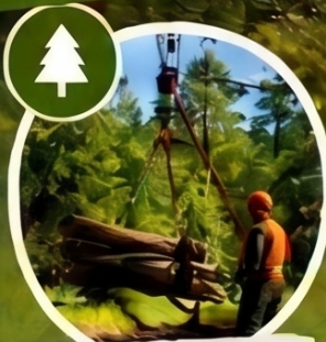
Moderne Forstarbeit mit Seilkrantechnik