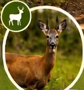
Die Jagdreviere unserer Region