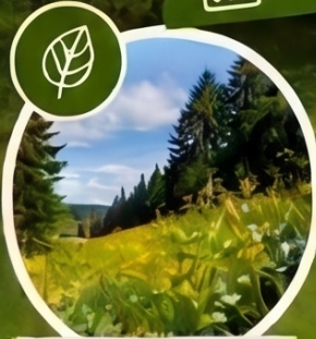
Waldrandpflege und Umweltpflege