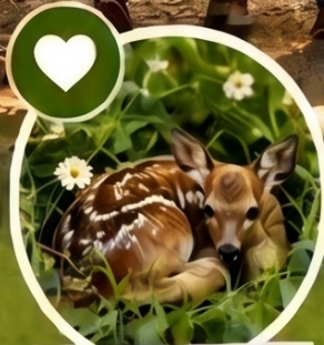
Rehkitzrettung damals und heute