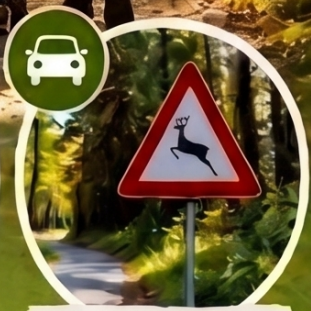
Wildtiere und Verkehrssicherheit