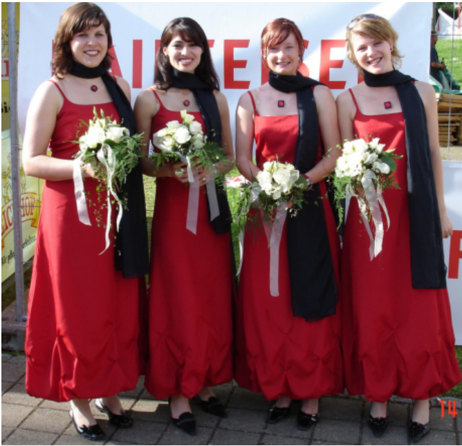
Die vier Ehrendamen 2006.

Ehrendamen sind ein fester Bestandteil des Schwingsports und haben einen hohen Stellenwert in der Schwingerfamilie. Ehrendame zu sein, ist eine sehr ehrenvolle Aufgabe, sie repräsentiert Tradition und Werte, indem sie Gäste betreut, an Festakten teilnimmt und die begehrten Eichenlaubkränze bei der Rangverkündung überreicht.