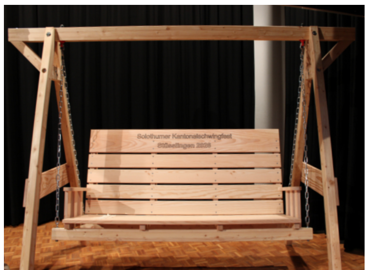
Eindrucksvolle Glocken und Hollywoodschaukel aus dem Gabentempel.